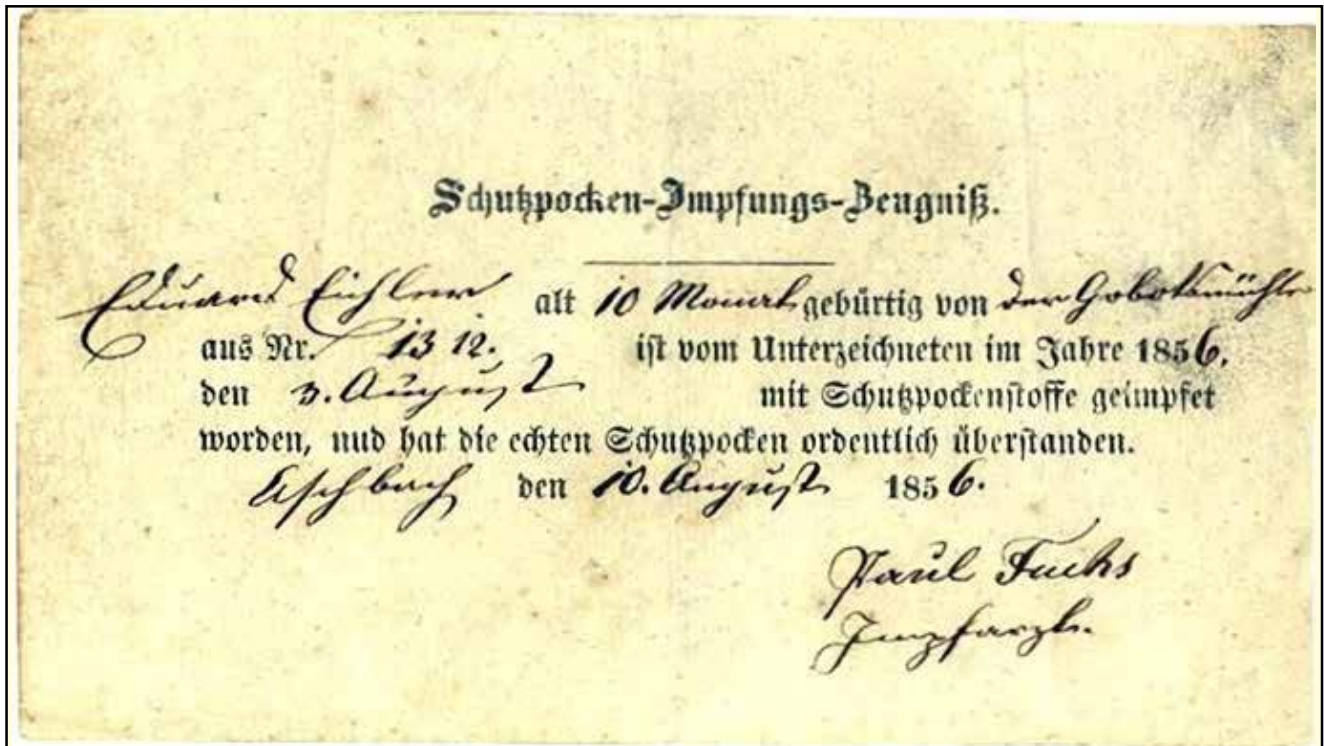
Abbildung 2. Impfzeugnis, 1856

ten Menschen an den Folgen der Impfung starb.